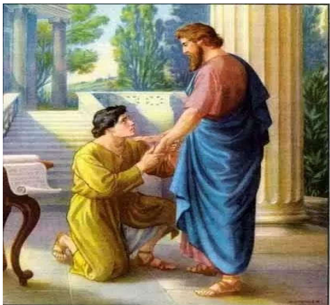
(阿尼西母向腓利门负荆请罪)

里负荆请罪。这意味着他愿意面对他应得的惩罚。阿尼西母选择了让神借着耶稣基督做他生命的主。从此他就成了神的仆人，成了一个有用的人。